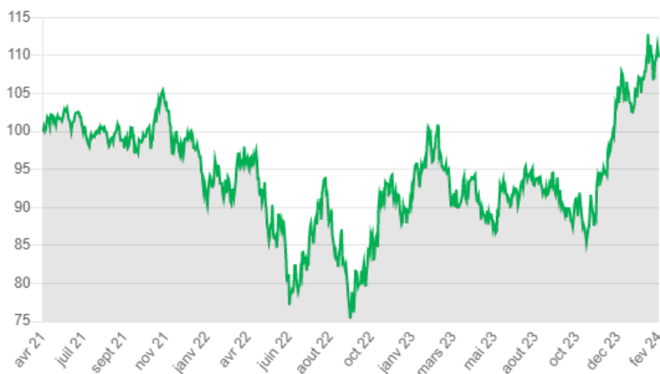
Performances mensuelles historiques du Certificat (% , nettes de frais):