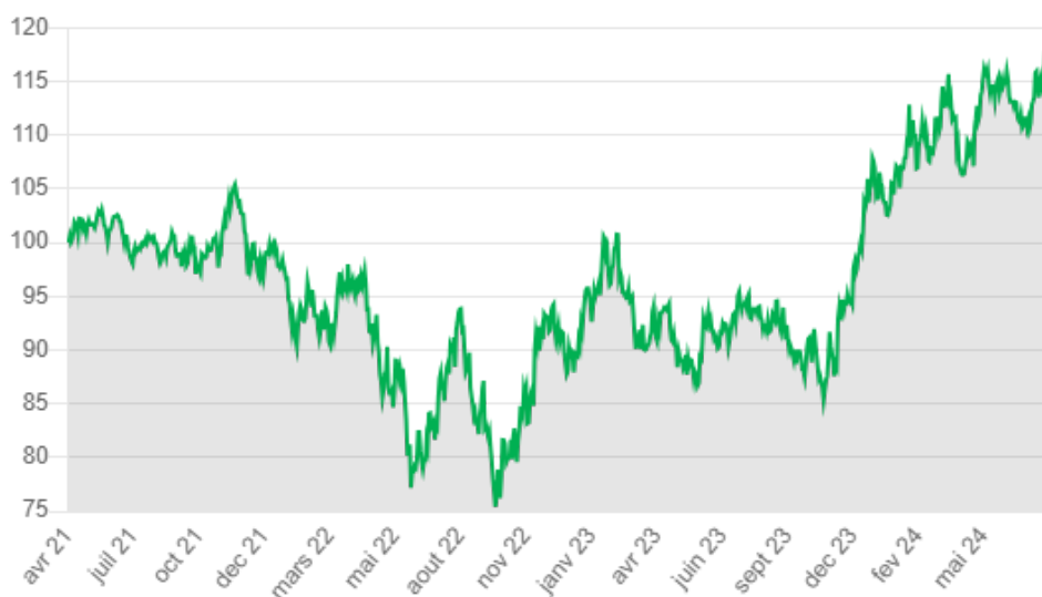
Performances mensuelles historiques du Certificat (% , nettes de frais):